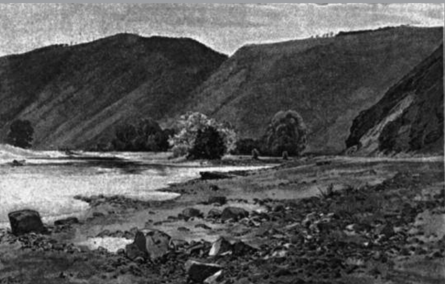
ZÁBĚHLICE u Zbraslavi.